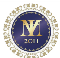
中小企業IT経営力大賞 日本商工会議所会頭賞